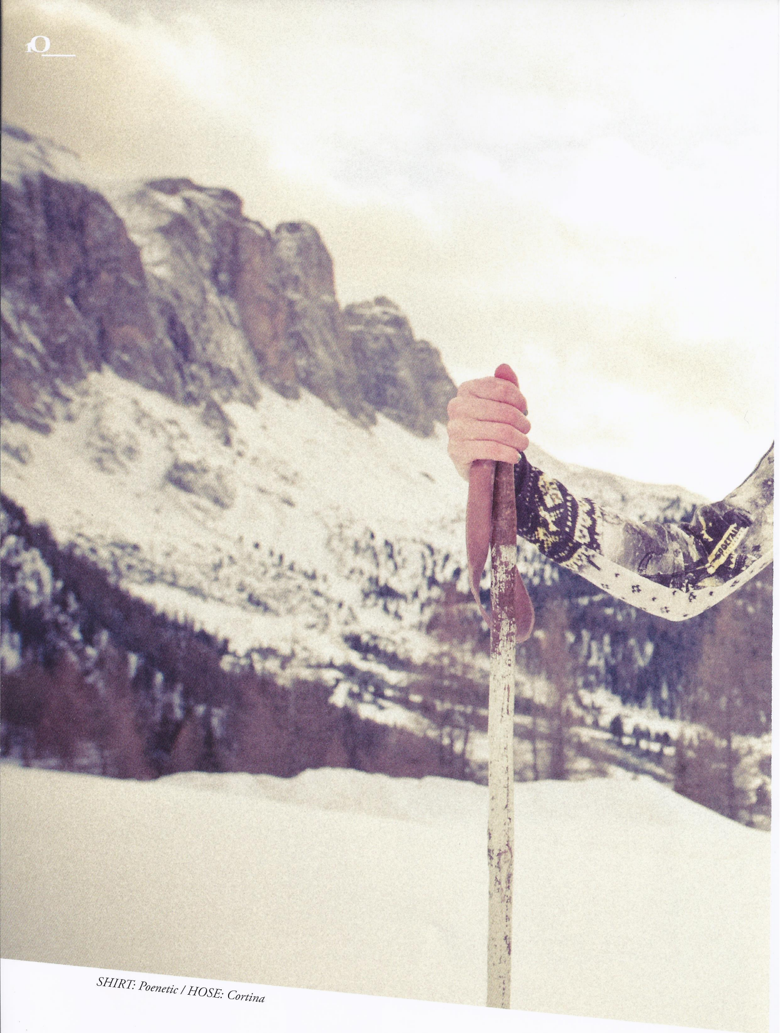
SHIRT: Poenetic / HOSE: Cortina