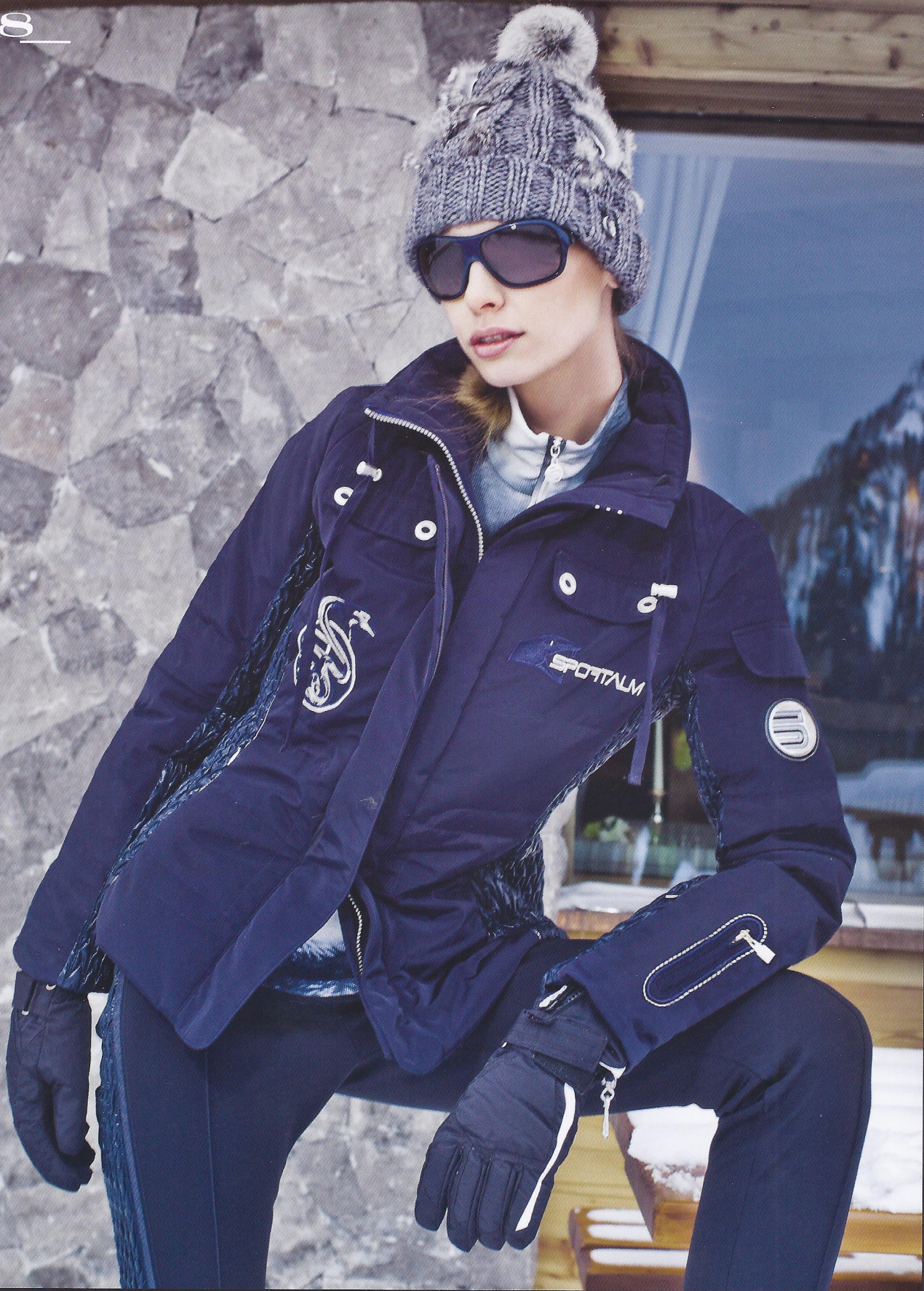
SKIJACKE: Steel / JETSHIRT: Mangan / SKIHOSE: Hybrid / MÜTZE: Mani Ma