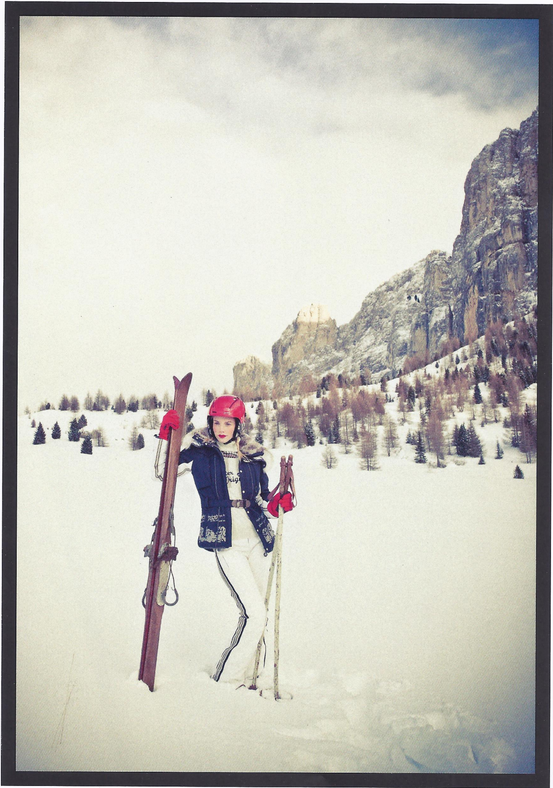
JACKE: Gunstock / STRICKPULLI: Gstaad / HOSE: Livigno