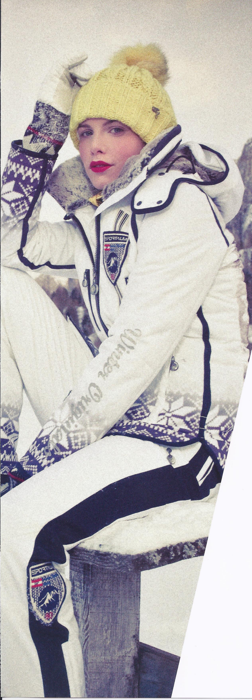
JACKE: Canyons / HOSE: Cortina / HANDSCHUHE: Bozen PC / MÜTZE: Baden