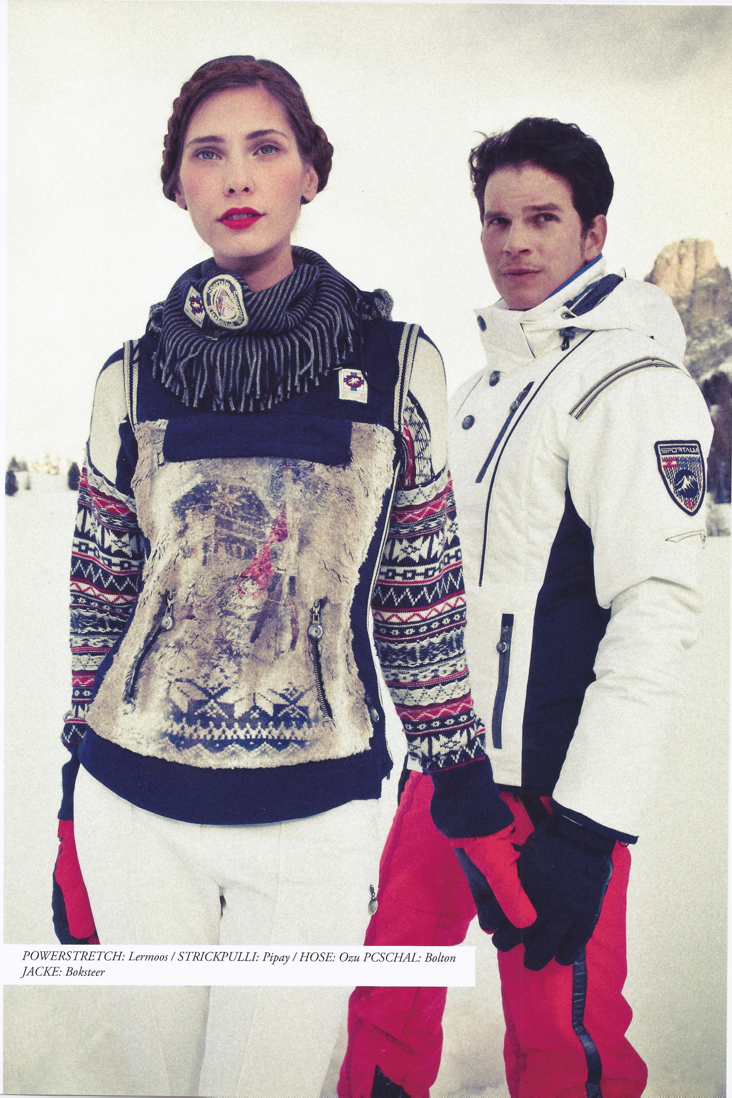
POWERSTRETCH: Lermoos / STRICKPULLI: Pipay / HOSE: Ozu PCSCHAL: Bolton JACKE: Boksteer