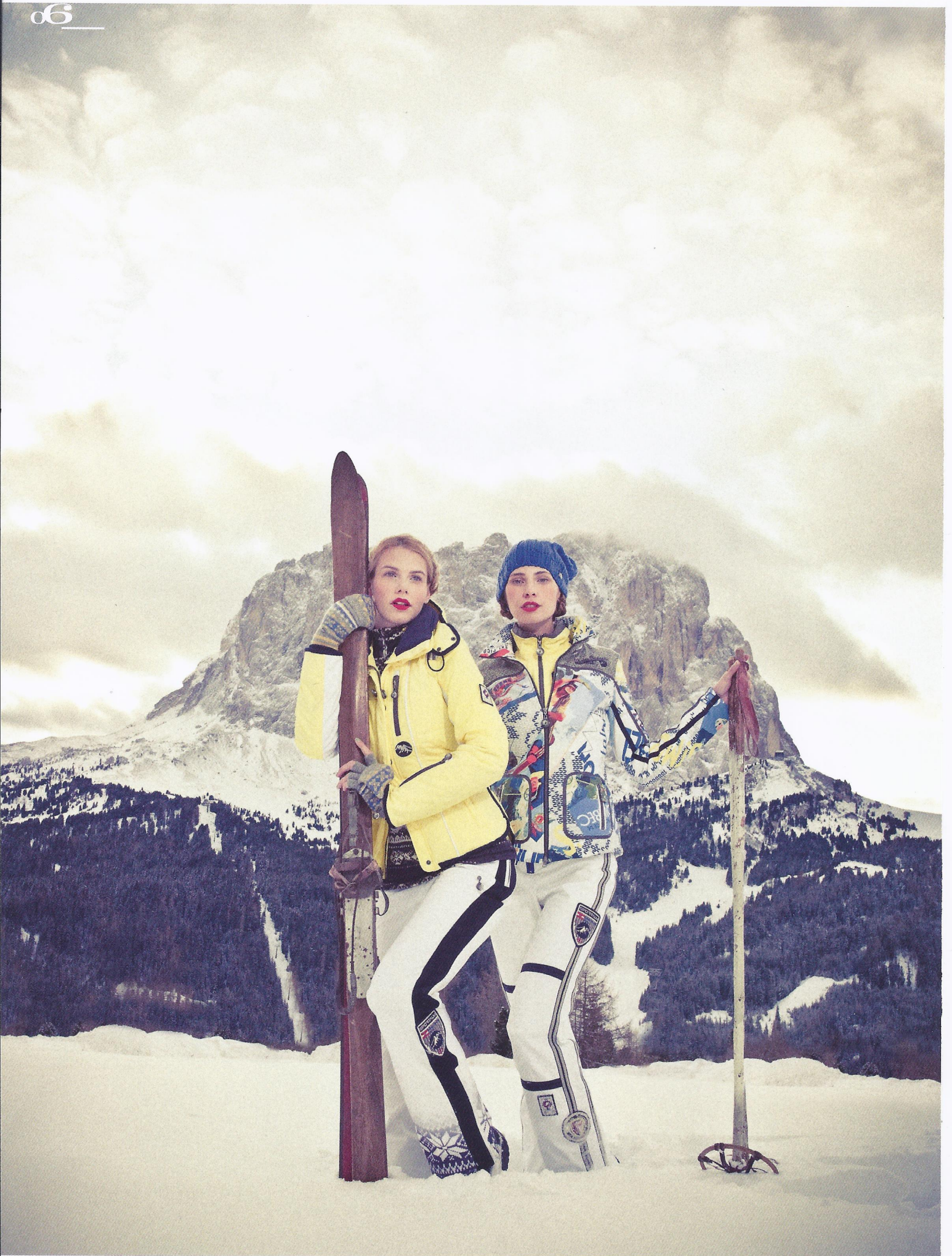
links JACKE: King Pine / SHIRT: Poenetic / HOSE: Cortina / HANDSCHUHE: Lillehammer rechts SOFTSHELLJACKE: Pats Peak / FLEECE: Trance / HOSE: Micante / MÜTZE: Baden